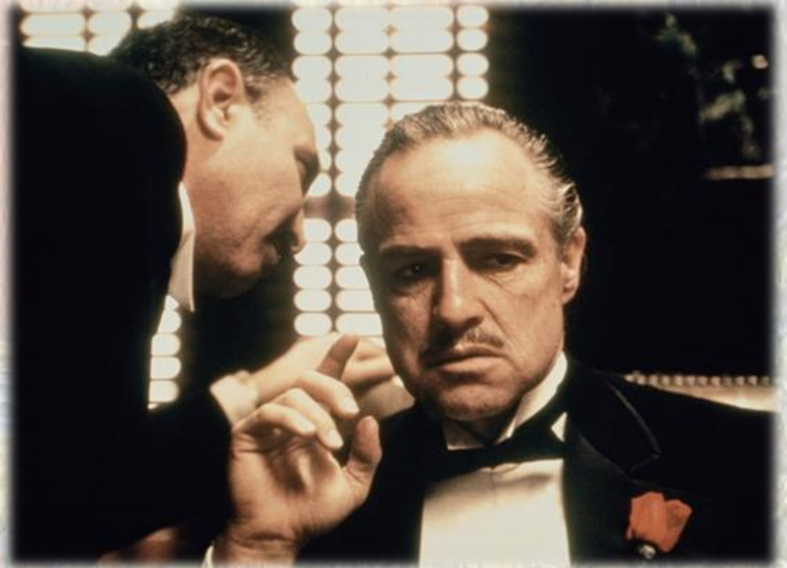
Francis Ford Coppola (1972) The Godfather