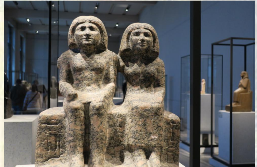
Para egipska, Muzeum archeologiczne w Berlinie