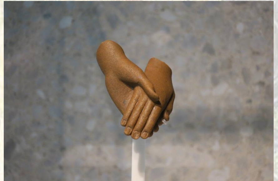
Echanton i Nefretete, fragment rzeźby, Muzeum archeologiczne w Berlinie