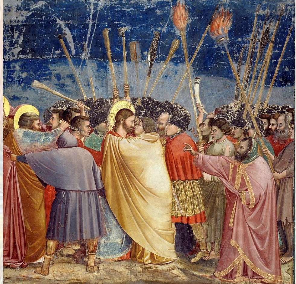
Giotto, Kiss of Judas