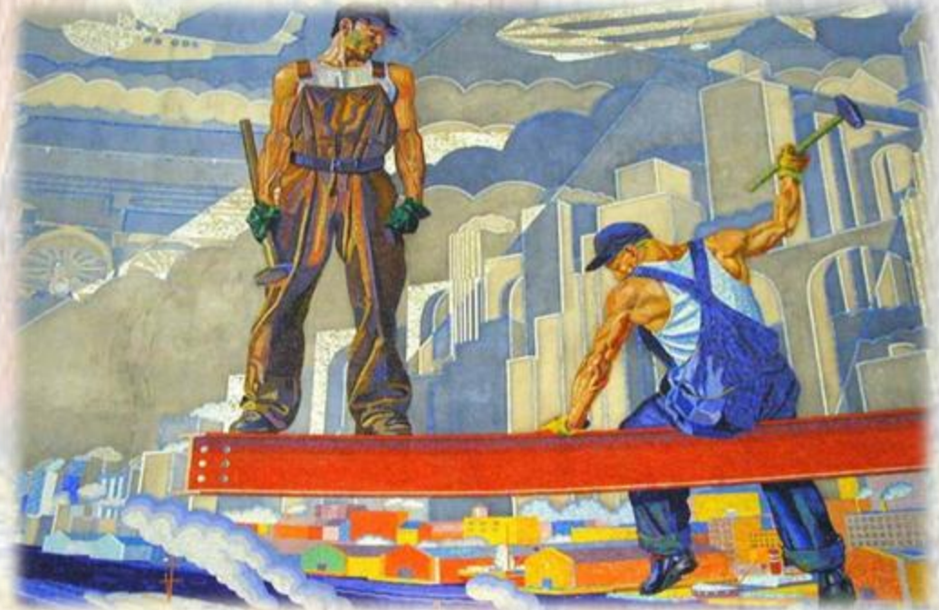
Winold Reiss, Cincinnati Union Terminal