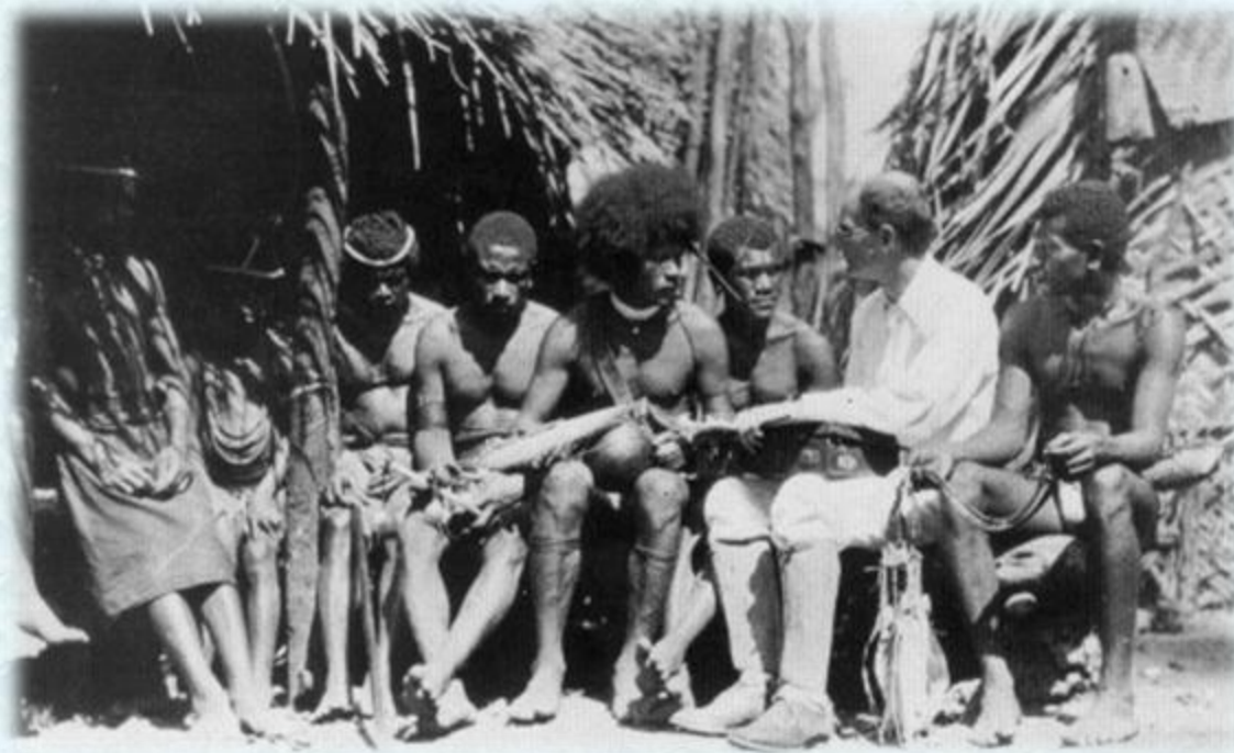
Bronisław Malinowski przeprowadza wywiad z mieszkańcami Triobrandów