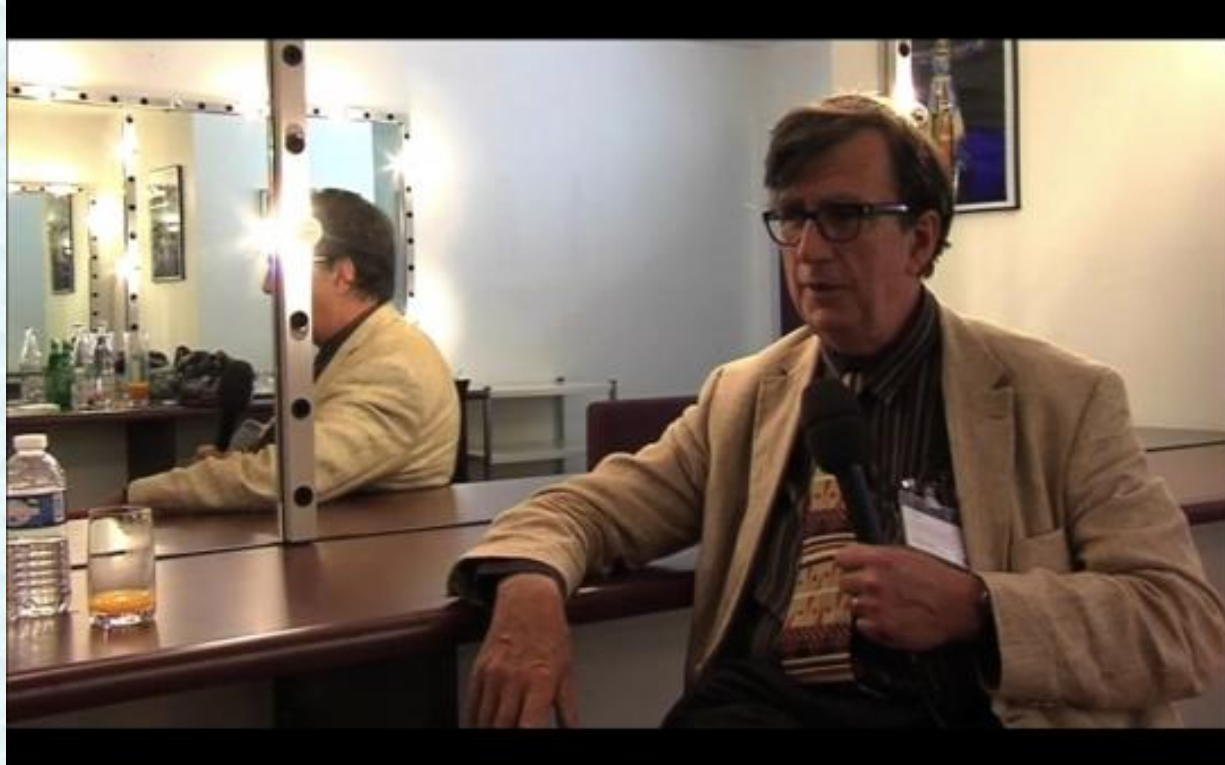
Bruno Latour – tu w roli rozmówcy